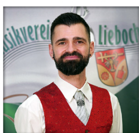
Musikalische Leitung Andreas Reisinger